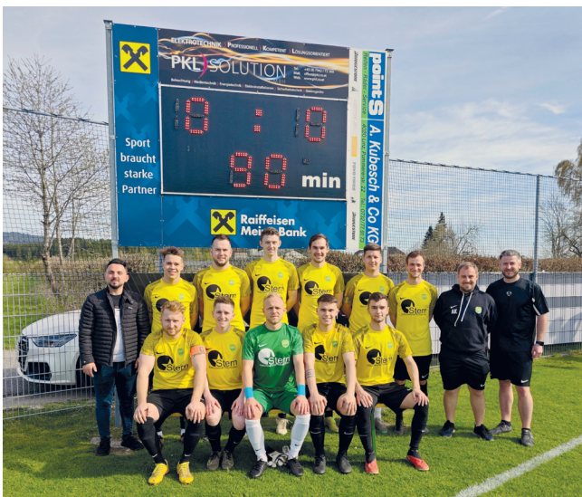
Im neuen Gewand und mit vollster Motivation ging es in die Frühjahrssaison. Vielen Dank an unseren Dressensponsor Pflasterbau Stern

Nach einer intensiven Vorbereitung bei der insgesamt 6 Testspiele auf dem Programm standen hatte unser Team genug Zeit sich nochmal auf die kommenden Aufgaben einzuschwören und so startete man top motiviert in das erste Meisterschaftsspiel gegen Bad Zell. Leider wurde dieses mit 2:1 verloren. Viel Zeit zum Ärgern blieb allerdings nicht den in der zweiten Runde kam es beim Spiel gegen Bad Kreuzen zu einem direkten Duell im Abstiegskampf welches mit 2:1 gewonnen werden konnte. In den nächsten 10 Spielen konnten wir 5-mal als Sieger vom Platz gehen. Bei 3 Spielen gab es eine Punkteteilung und nur in 2 Spielen mussten sich unsere Mannen geschlagen geben. Nach dieser sehr guten Leistung standen vor dem letzten Spiel der Saison 26 Punkte (21 davon im Frühling!) zu Buche. Im letzten Spiel gegen Perg/Windhaag war klar, dass mit einem Sieg zumindest die Relegation fixiert werden konnte. Zum direkten Nichtabstieg brauchte es noch Schützenhilfe aus Tragwein. Nach einem 1:0 Sieg und einer dramatischen Schlussphase im Parallelspiel hieß es am Ende RAINBACH BLEIBT ERSTKLASSIG. Herzlichen Glückwunsch und vielen Dank an alle Beteiligten, die dieses „Fußballwunder“ möglich gemacht haben. Diese Saison wird mit Sicherheit als eine der geschichtsträchtigsten in Erinnerung bleiben.