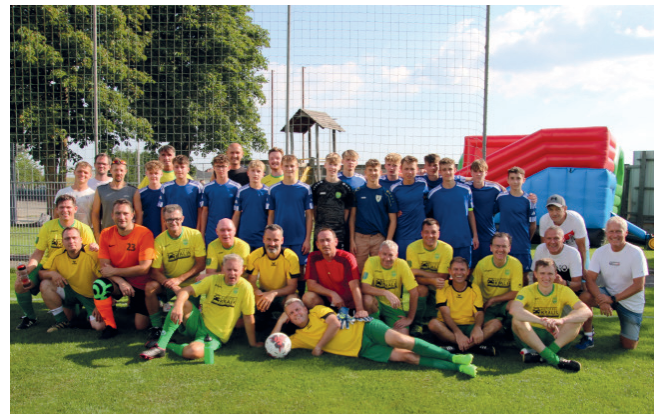
„Tag des Fußballs“

Der 19 August stand folglich ganz im Zeichen des Fußballs und so spielten ab Mittag die U-13 Mannschaften aus Windhaag, Reichenthal, Bad Zell und Rainbach ein Blitzturnier. Es folgte ein Spiel der Rainbacher Legenden, wo sich viele Kicker der letzten zwei Jahrzehnte, aus dem In- als auch Ausland mit den NW-Spielern der U16 matchten. Es war ein Wiedersehen von vielen bekannten Gesichtern und es besteht auf alle Fälle Wiederholungsbedarf.