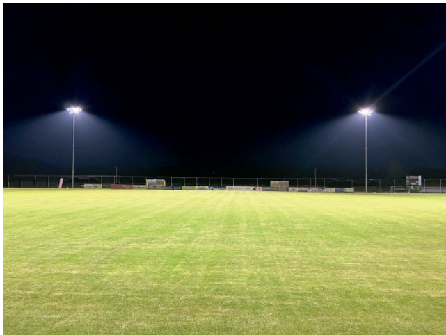
LED-Flutlichtanlage bei der Probebeleuchtung